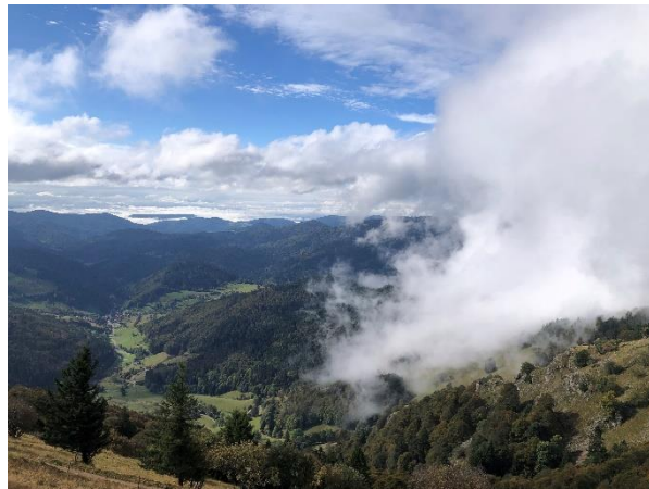
Karte BG Schwarzwald; Blick vom Belchen

Nach der Anreise am Donnerstag in das ruhig gelegene Seminarhaus und dem gemeinsamen Kochen standen das gegenseitige Kennenlernen sowie das Begrüßen neuer TeilnehmerInnen im Vordergrund.